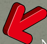
Niwki (Gmina Chrzastowice)

W Niwkach można zobaczyć także tablicę pamiątkową poświęconą ofiarom I i II wojny światowej.